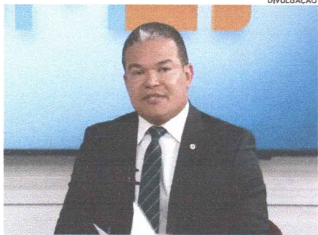
Coronel Sílvio Leite, titular da Secretaria de Estado da Segurança Pública do Maranhão

Os esforços do governo do Estado, a partir de ações da Secretaria de Estado de Segurança Pública (SSP-MA), levaram à redução das ocorrências de mortes violentas em todo o território maranhense. O Maranhão é o primeiro estado do Nordeste e o 14º do Brasil na redução destas criminalidades e se destaca ainda com a segunda menor taxa de homicídios do país. Entre as capitais brasileiras, São Luís é a que possui o menor número de registros. Os dados, referentes ao ano de 2021, são do Anuário Brasileiro do Fórum de Segurança Pública, divulgado no final de junho. Dados da SSP-MA apontam a redução em 14% nos roubos a veículos e assaltos a ônibus; de 47% nos homicídios; e 50% nas mortes violentas (lesão corporal e morte, roubo seguido de seqüestro e latrocínio e homicídios). Isso é fruto dos constantes investimentos que tivemos em segurança pública e que vêm ocorrendo desde 2015. Inclui o aparelhamento do sistema, investimentos em pessoal com a capacitação e ações de valorização, aquisição de viaturas, munições e equipamentos, além de investimentos na